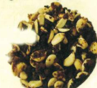
Campuran bawang putih dan gula merah