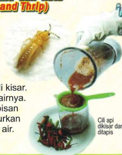
Cili api dikisar dan ditapis