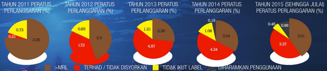
SAYURAN YANG DITOLAK MENGIKUT SUSUNAN PERATUS YANG TERTINGGI