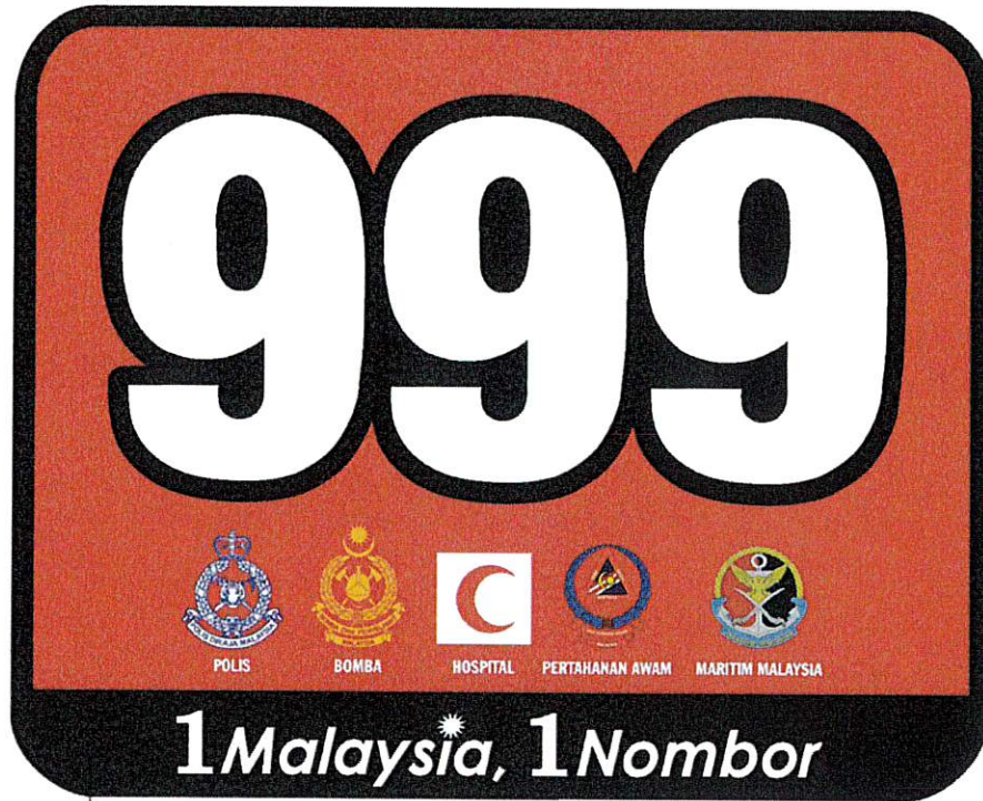
Logo MERS 999