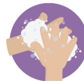
Selalu Membasuh Tangan

Jika setiap rakyat di negara ini kekalkan disiplin dan patuhi SOP, maka kita pasti akan dapat memutuskan rantai jangkitan Covid-19.