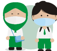
Sentiasa Memakai Pelitup Muka