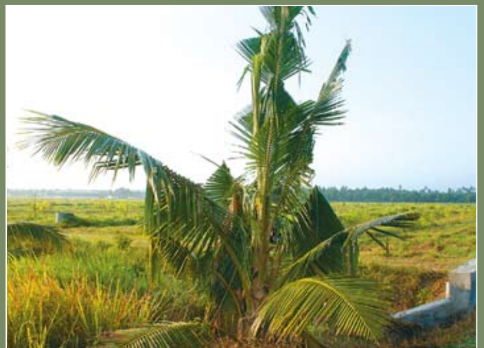
Simptom serangan kumbang tanduk