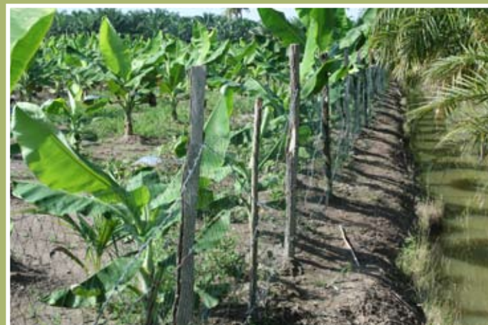
Kawalan menggunakan pagar pukut