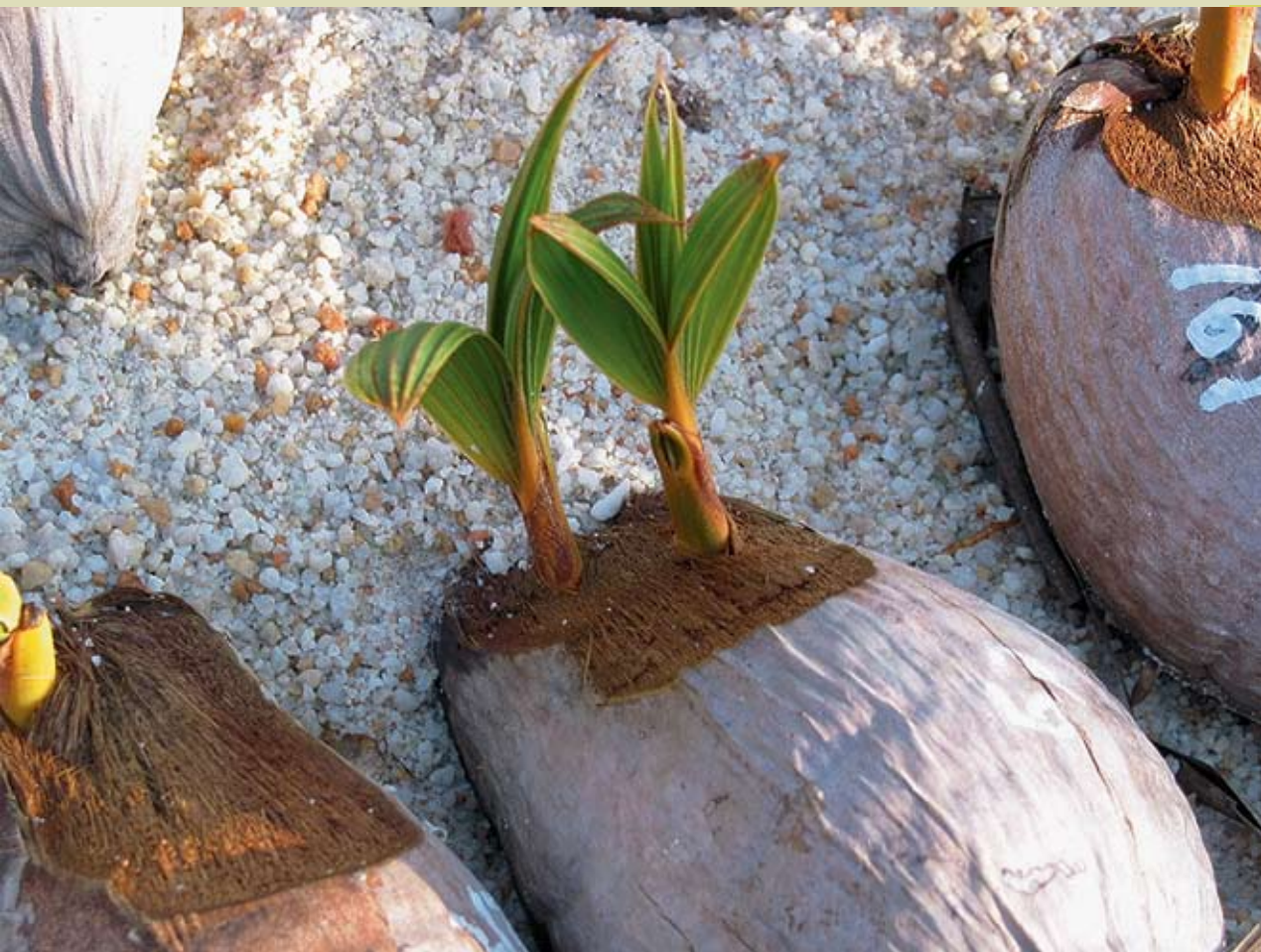
Contoh : Anak benih kembar yang perlu ditakai

Bilangan anak pokok yang dibuang daripada aktiviti penakaian ini lazimnya di sekitar 10-50%. Anak-anak benih kelapa yang sesuai ditanam di ladang mempunyai ciri-ciri seperti daunnya yang besar dan berwarna hijau tua, pelepahnya pendek dan lebar serta batangnya lurus dan tiada serangan perosak.