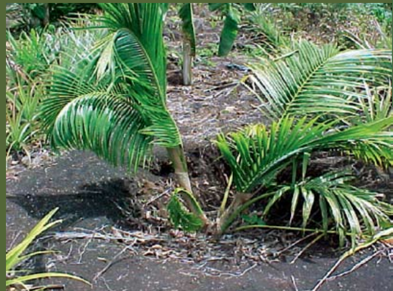
Simptom Serangan Kumbang Jalur Merah