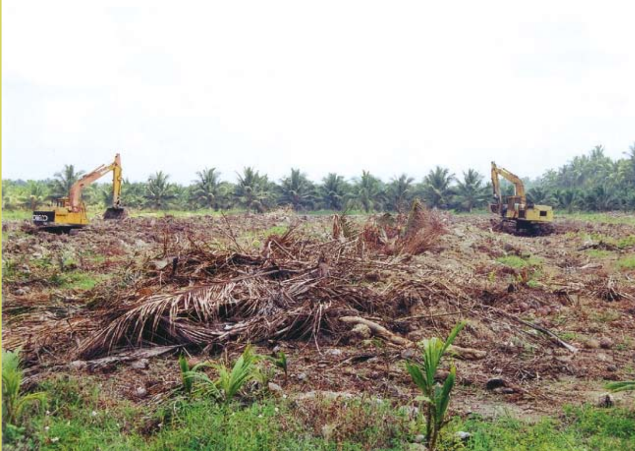
Pembersihan kawasan menggunakan jentolak

Bagi kawasan bekas kelapa tua, sebaik-baiknya pembersihan kawasan dilakukan dengan menggunakan jentolak. Jentolak ini dapat menumbang dan menghancurkan batang kelapa dan menyusunnya mengikut barisan tertentu. Dengan cara ini proses pereputan dan aktiviti-aktiviti ladang seterusnya dapat dilaksanakan dengan lebih mudah.