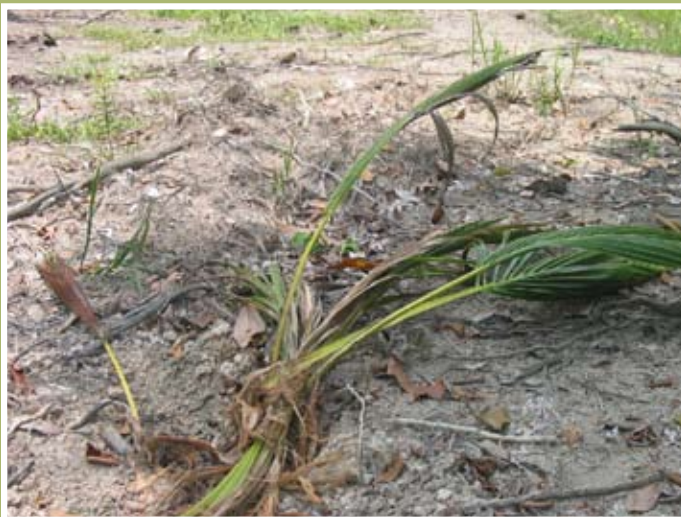
Akibat serangan babi hutan