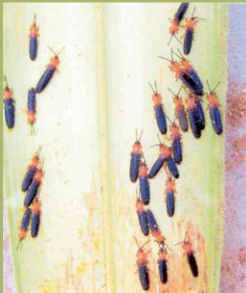
Kumbang Plesispa ( Plesispa reichei )