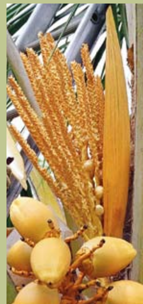
Jambak Bunga Kelapa