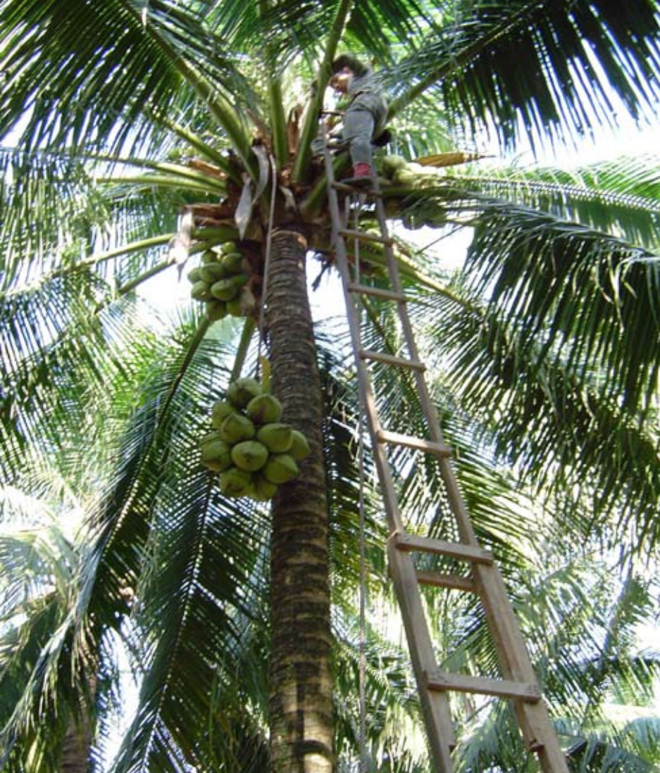
Memetik kelapa muda menggunakan tangga dan tali

Sebahagian besar daripada buah kelapa yang dipungut akan dibelah dan dicungkil isinya untuk dijual sebagai kelapa patik ke kilang-kilang yang mengeluarkan kelapa parut kering. Bagi pengeluaran kopra, isi kelapa dikorek keluar dari tempurung dan dikeringkan bagi mengurangkan kandungan air daripada 55% kepada 5 - 7%.