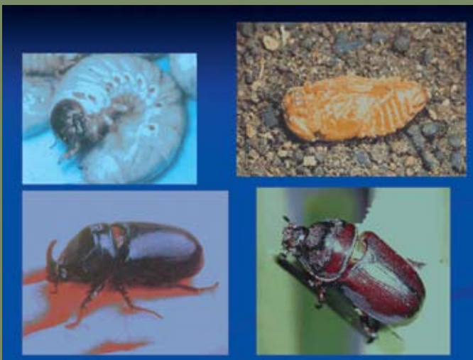
Larva dan kumbang tanduk dewasa

Kumbang tanduk dewasa bertelur di dalam batang kelapa yang reput, bahan organik ataupun sampah-sarap. Larva yang dikenali sebagai “grub” kumbang tanduk akan hidup pada bahan yang reput ini sehingga pupa.