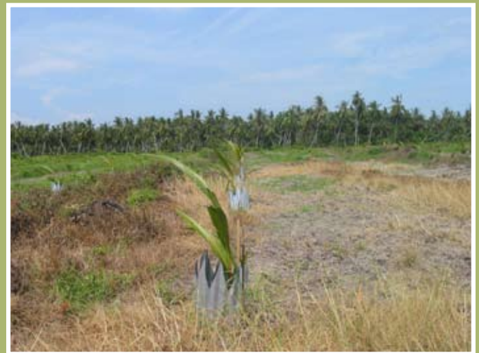
Kawalan menggunakan zink