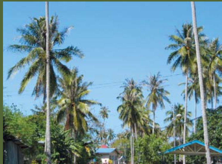
Simptom Serangan Artona

Jika serangan serius (berlaku musim kering), kawal secara suntikan batang dengan racun monocrotophos (azordrin) atau metamidophos (tameron) pada kadar 5-10 m/pokok. Jika larva hampir membentuk pupa, tidak disyorkan suntikan batang kerana kawalan tidak akan berkesan.