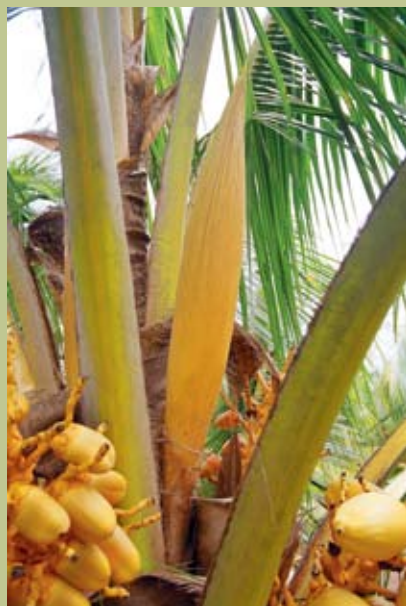
Seludang yang belum terbuka

Bunga betina berbentuk globos, mengandungi enam periant dan terdapat pistil berwarna putih. Bunga betina mulai kembang pada 18-21 hari selepas seludang terbuka. Jangkamasa reseptifnya ialah 1-3 hari.