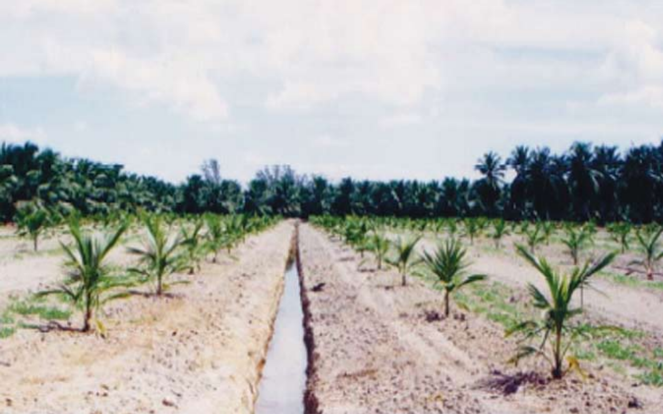
Penanaman secara sistem camber